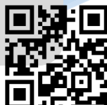
Le blog du CRI