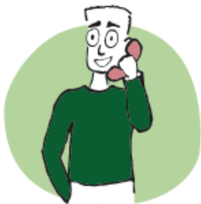
- par téléphone