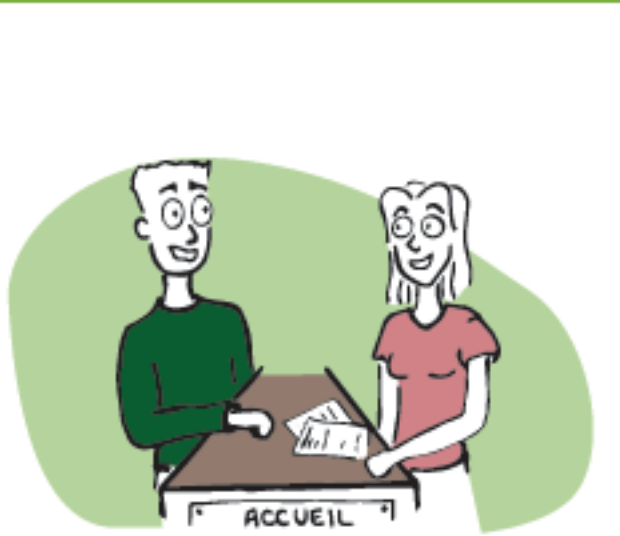
- en me déplaçant