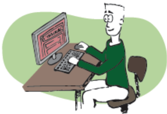
- sur le site internet de La POL